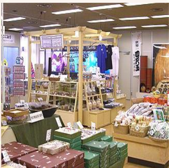
サンプラザショップ

※限定10組(40名)、前半ハーフで集計致しますので お帰りの際に賞品をお渡し致します。